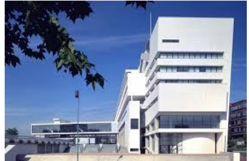
Chênes (L2 et L3)