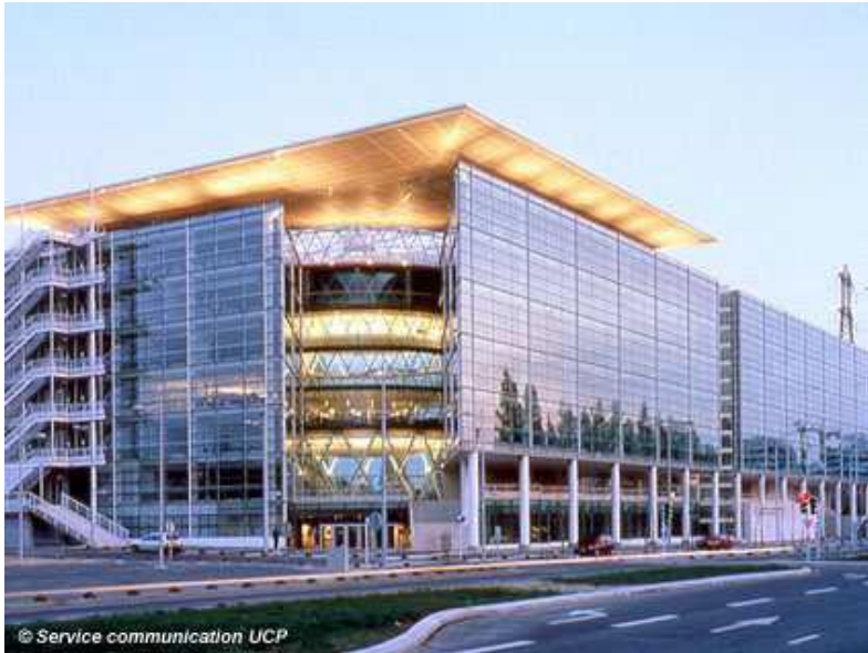
Saint Martin (L1)